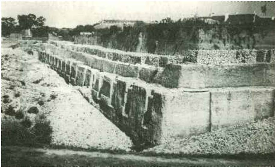
Rušenje bedema Tvrđe sa zapadne strane

I urbanistički i arhitektonski izgled značajno su se promijenili pod utjecajem moderne arhitekture, koja se u Hrvatskoj pojavila 20-ih godina 20. stoljeća. Prostorni razvoj Osijeka usmjeren je na područje istočno od današnje Ulice kardinala Alojzija Stepinca, i to prema jugu između Perivoja kralja Petra Krešimira IV. i željezničke pruge izgradnjom blokova ispunjenih uglavnom stambenim zgradama, s ugođajem rezidencijalnog dijela grada. U četverogodišnjem razdoblju (1922. - 1926.) Tvrđa, jedinstvena urbana cjelina, ostala je bez svojih zidina. Očuvani su samo dijelovi prvog i osmog bastiona te Vodena vrata. 10