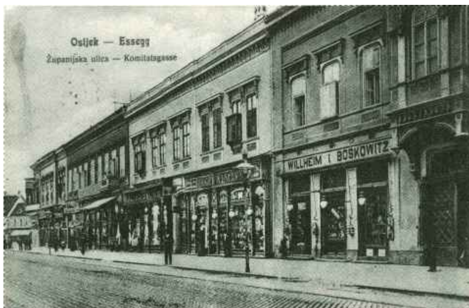
Središte Gornjega grada

s obzirom na promet ljudi i roba između Sredozemlja i Podunavlja, samoga podunavskog bazena i srednjoeuropskih gospodarskih središta - pružao pogodnosti za rad i suživot ljudi različitih narodnosti i vjera. No, pri tome nije bilo lako i jednostavno zadržati primat upravnog 5 , privrednog, prosvjetnog, zdravstvenog, kulturnog i sportskog središta Slavonije, Srijema i Baranje 6 , jer su od kraja 20-ih godina 20. stoljeća iz Osječke oblasti 7 , kojoj je Osijek bio središte, izdvojeni kotarevi Vinkovci, Vukovar i Županja, područja koja su cestama i željezničkim prometnicama inače povezana s Osijekom.